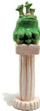
Vegetation Goddess, 1972

5.2 x 10.0 x 4.2, Low fire talc based clay, commercial glaze