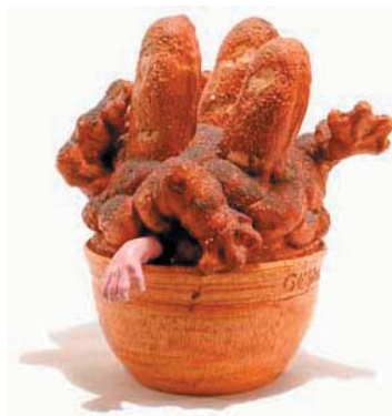
Soup Tureen, 1977

10.7 x 14.0 x 11.8, Low fire talc based clay, mixed media