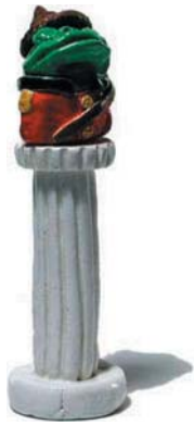
Mountie Frog on Pedestal, c.1972