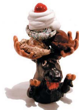
Chocolate Moose, 1977

38.7 x 30.9 x 26.1, Clay, glaze, mixed media