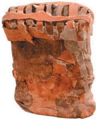
Flower Brick, c. 1965