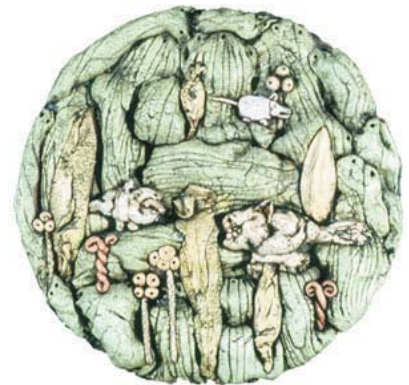
Two Meanies on a Mountain, 1976

7.4 x 18.0 x 18.0, Stoneware, wheel thrown, incised, glazes