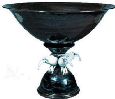
Pedestal Bowl, 1991

41.5 x 127.7 x 21.2, Earthenware, sawdust fired, wood