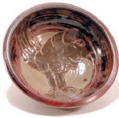
Bird Bowl, 1976

34.4 x 26.7 x 12.1, Stoneware, slab built, glaze