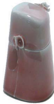
Rock Box, "Coupes pluviales sur glace . . . rain cups on the rocks", 1981

10.0 x 9.9 x 7.8, Porcelain, cast, slip trailed, brushed, appliques, blue watercolour under reduced copper glaze