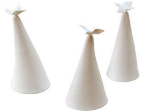
The Choir . . . Le chœur de chant, 1995-96

9.4 x 5.1 x 5.5, Porcelain, cast, slip trailed, brushed, appliques, blue watercolour under reduced copper glaze