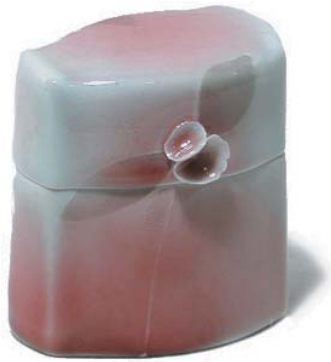
Wist Box, "Wings like after . . . and erin and wists and things . . . Souhais de ma fille", 1981

Collection of the Burlington Art Centre.