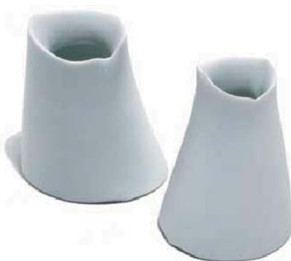
Pair of Stump Vases, "Tree Spirits . . . Genies des bois", 1996

18.0 x 9.0 x 9.0, Translucent Porcelain bisque, reduction fired to cone 13; Bells: cast, tooled, brushed; Birds and clappers: sculpted, brushed, terra sigillata